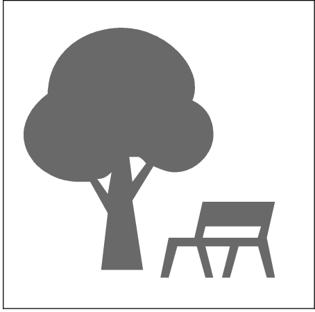
【 A 】