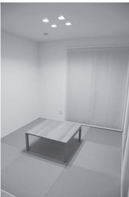
▲洋風建築に畳を使用している和室

長い間受け継がれた文化であり、やはり素足に感じる畳の感触は心地よい。数々の魅力のある畳は、形は変わるかもしれないが、今後も受け継がれていくことだろう。