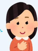
小学校の先生より

小中のつながりを意識して、今後も本時の「めあて」「振り返り」を行っていきたいです。