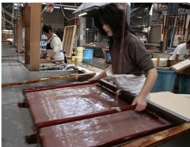
【和紙をすいている様子】