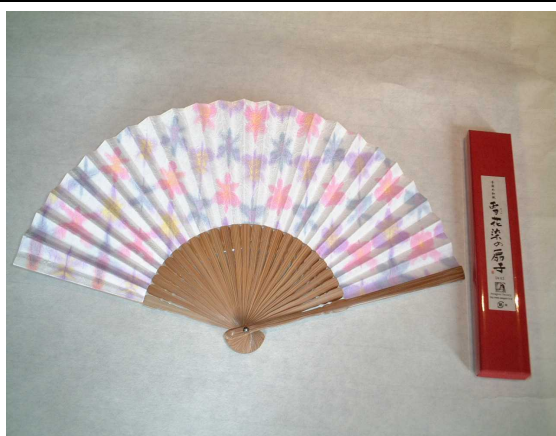
【阿波和紙で作ったせんす】